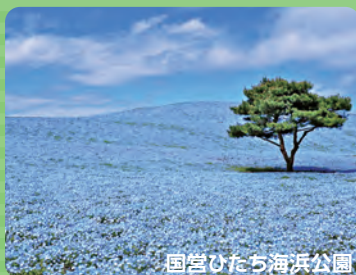
国営ひたち海浜公園